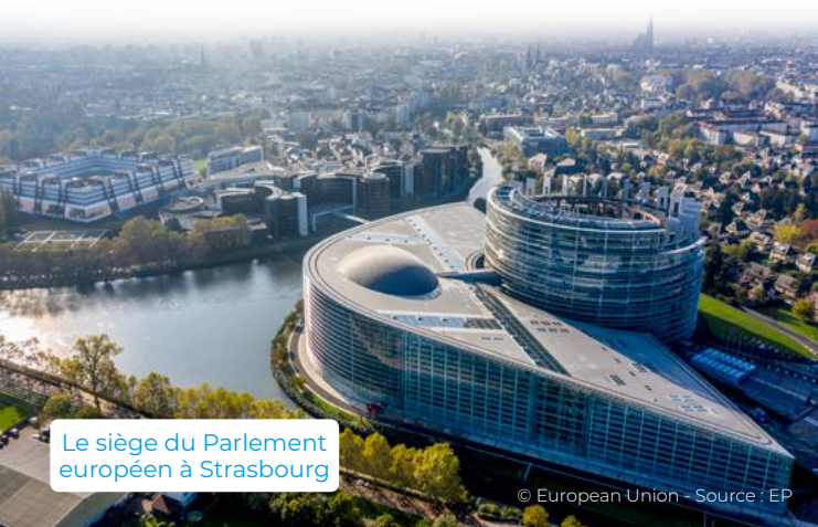
Le siège du Parlement européen à Strasbourg